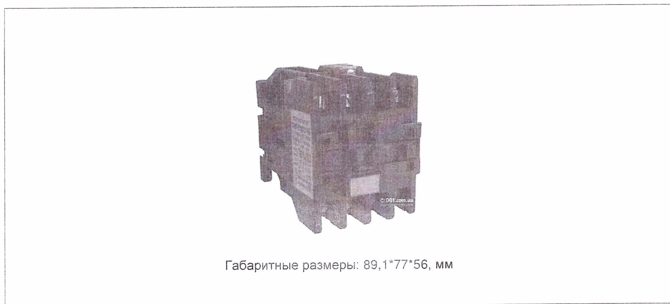
Рис.1. Габаритные и установочные размеры